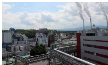
Spürhunde durchsuchten das Werksgelände.